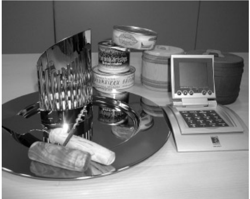
Viestintäpalveluiden lahjavara-kaapista löytyy yliopiston logolla varustettuja koriste- ja käyttöesineitä. Jotain on myös herkkuille. Viimeiset kappaleet kellokalentereita myydään puoleen hintaan.

Lisätietoja ja kuvia lahjavalikoimasta löytyy osoitteesta < http://www.hallinto.oulu.fi/viestin/pr-tuotteita.html >